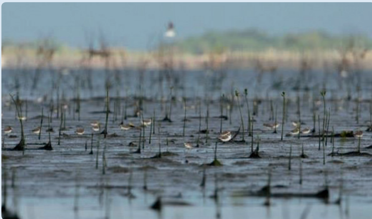
Mga patay na bakawan na naitanim sa lugar na walang dating bakawan at lubog sa dagat ng matagal bawat araw kaya walang sapat na oksigen

Sa ilang bahagi ng mga malalaking daanan ng mga ibon sa mundo, mga putikan at iba pang tirahang naikokonekta sa kanila na nagsisilbing 'mga papaliit na lugar' na nagsisilbing napakahalagang lugar-pahingahan at kainan para sa mga naglalakbay na mga tubigibon. Ilan sa mga lugar na sumusuporta sa mahigit sampung libo hanggang milyong mga ibon ang Golpo ng Mottama (Myanmar), Panama Bay, Banc D' Arguin (Mauritania), Manila Bay, Loobang Golpo ng Thailand, Mekong Delta (Vietnam). Itinalaga na ang ilan bilang mga lugar na pinoprotektahan, mga itinalaga na Ramsar na lugar at World Heritage na lugar kung saan nabibigyang-halaga ang kanilang importansya para sa mga hayop. Maaaring makasira ang pagpapalit ng gamit ng ang mga internasyunal na mahahalagang tirahan na ito sa pamamagitan ng pagtatanim ng mga bakawan na mga tirahan ng ganitong mga uri ng hayop at makadaragdag ito sa patuloy na pagkaunti nito.