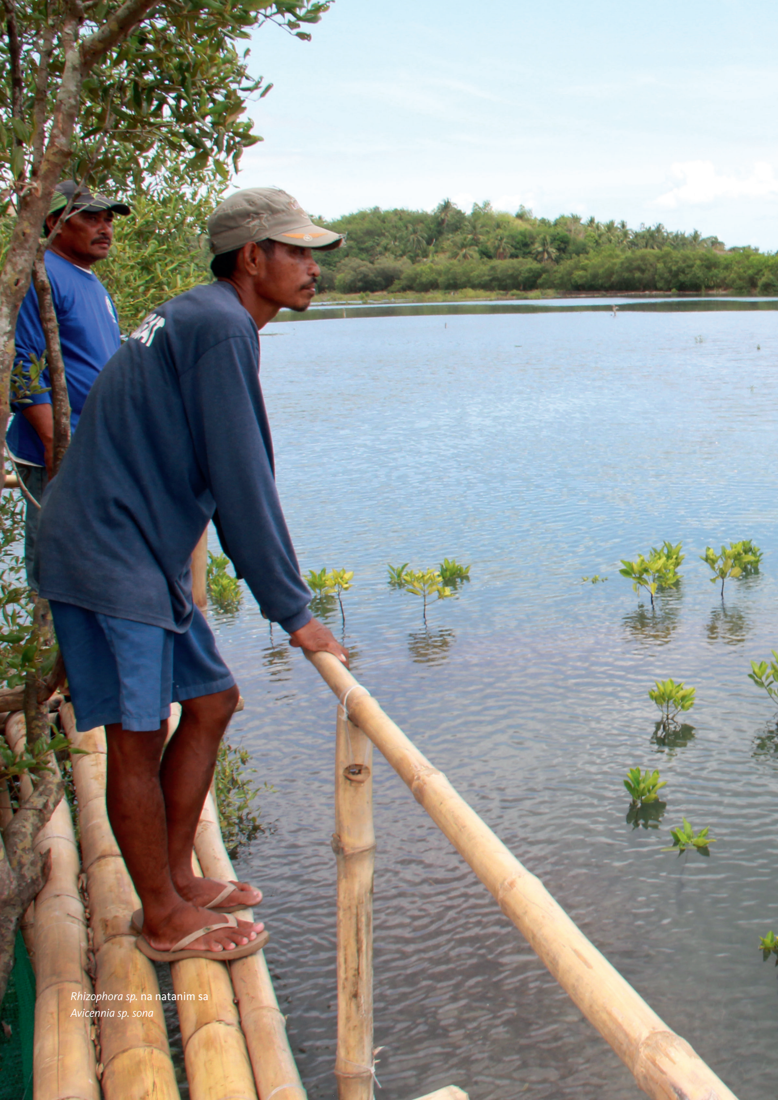
Rhizophora sp. na natanim sa Avicennia sp. sona