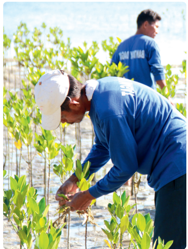
Hindi tama ang pagtatanim ng iisang uri ng bakawan sa mga lugar na hindi dating sakop ng mga bakawan, tulad ng mga putikan sa baybayin